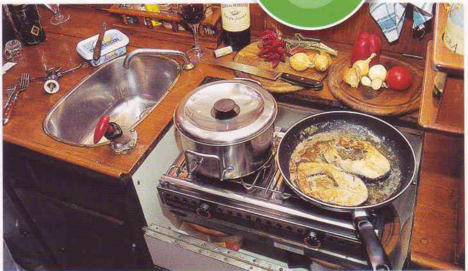
Lachssteak mit Zwiebeln und Kartoffeln. Mit etwas Planung ißt man an Bord wie zuhause

Zwei Stahlfedern, eine kurze Kette und drei Haken fixieren jeden Topf sicher auf