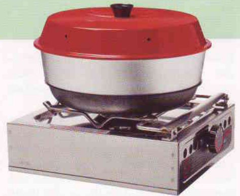
Backen ohne Ofen. Über ein ausgeklügeltes System verteilt sich die Hitze so, dass sogar „Oberhitze“ möglich ist.

Im kleinen Salon halten sich Bratgerüche besonders hartnäckig. Sofern im sicheren Hafen gekocht wird, ist ein ganz gewöhnlicher Campingkocher im Cockpit für frisch gefangenen Fisch oder andere Pfannenzubereitungen häufig die bessere Alternative als der Kocher in der Pantry.